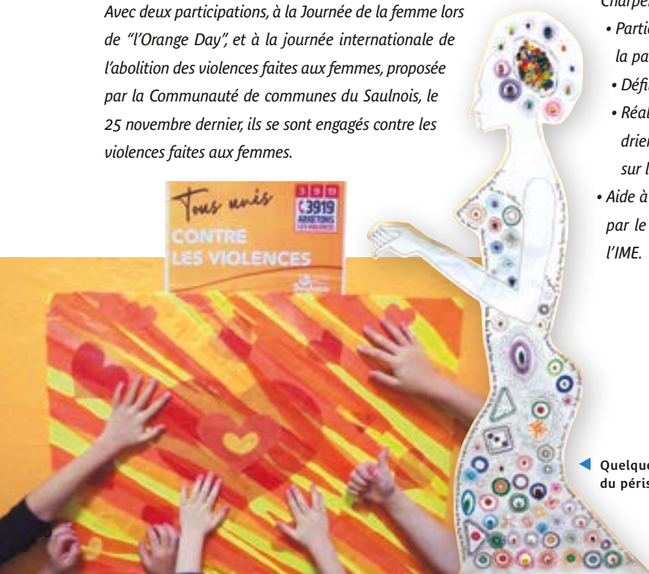
◀ Quelques-unes des œuvres du péricolaire...